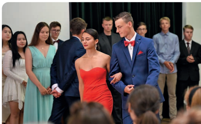
Loučení volarských deväťáčků.