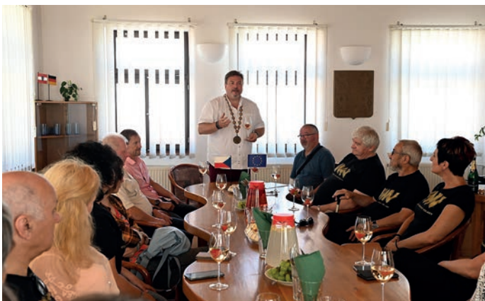
Účastníci 7. Výtvarného Workshopu Volary na radnici.