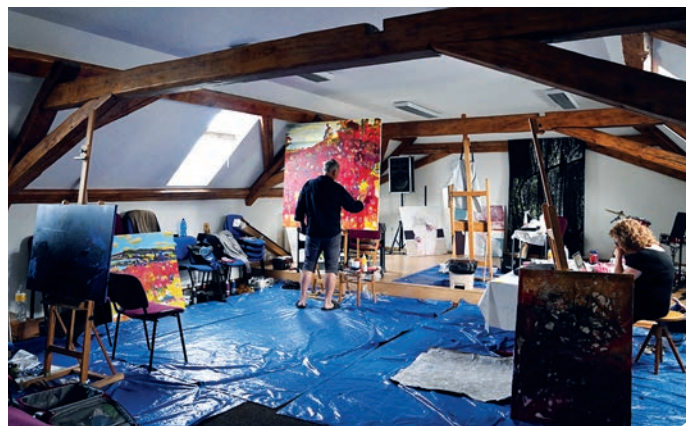
Sedm zemí, čtrnáct malířů. Výtvarný Workshop Volary.