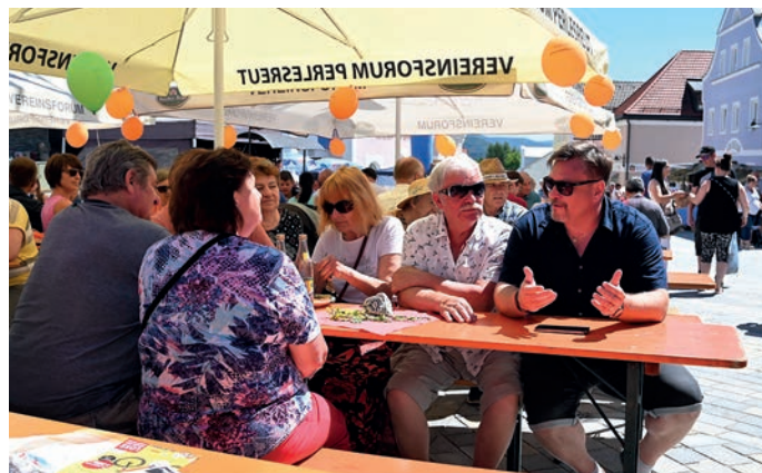
Městské slavnosti v Perlesreutu.