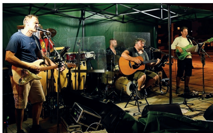
K posezení na rynku hrál Kamelot Tribute a Flám.