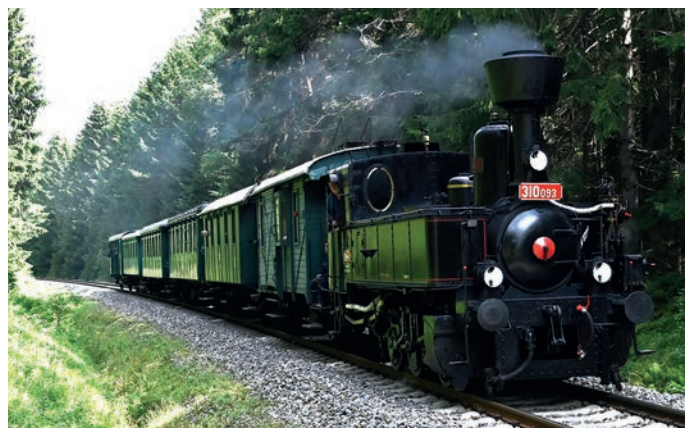
Volarsko brázdil Kafemlejnek.