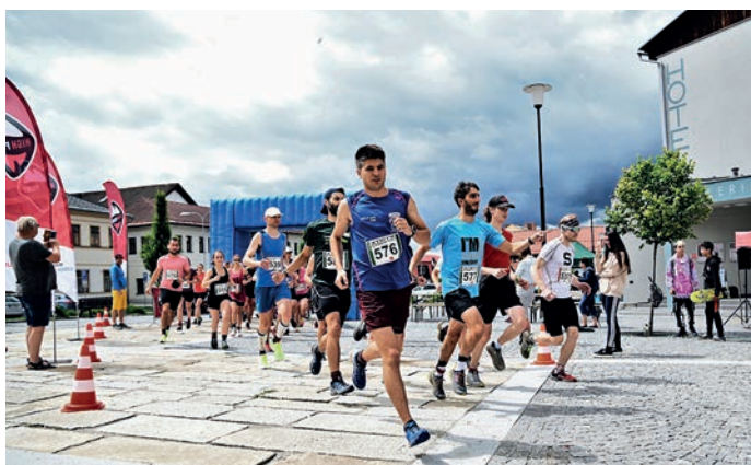
Vytrvalostní běh Tři vrcholy.