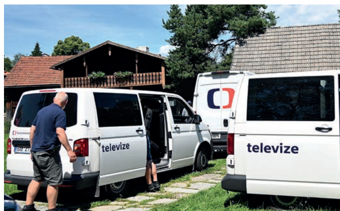
Česká televize natáčí ve Volarech.