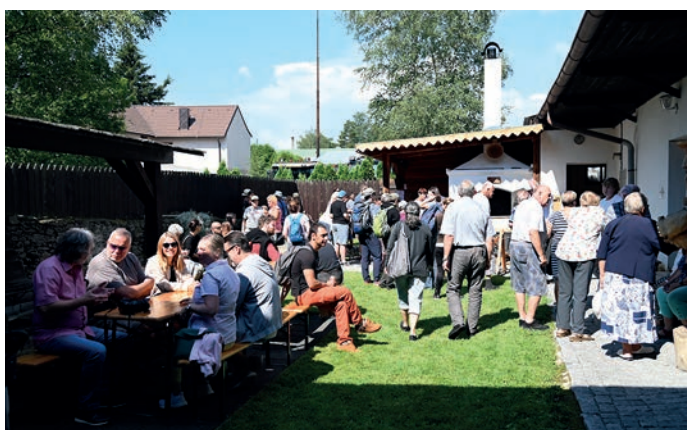
Na pečení bylo opět plno.