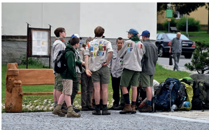
Belgičtí skauti ve Volarech.