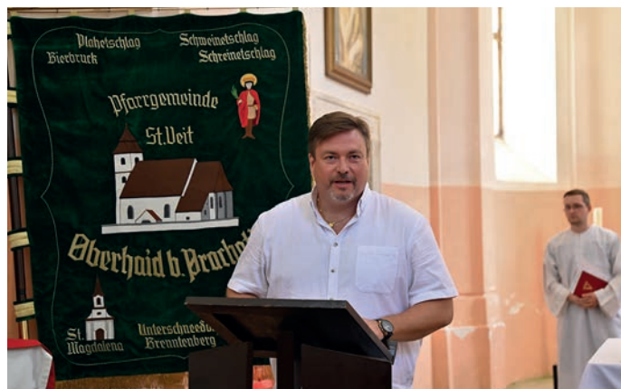
Setkání rodáků ve Sv. Magdaléně.