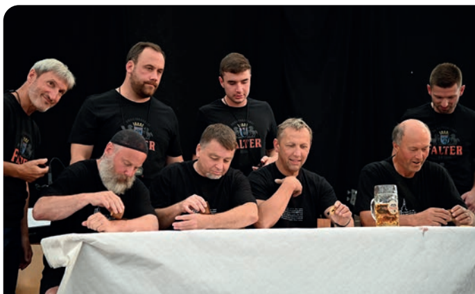
Volary si v Perlesreutu vyšňupaly stříbro.